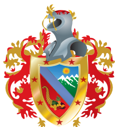
Gobernación del Huila

Para este proyecto, el Gobierno Departamental asignó recursos del Sistema General de Regalías para el desarrollo de capacidades en gestión de la innovación empresarial del sector turismo, economía naranja y agropecuario del Huila y dio prioridad a las inversiones liderando las mesas del CODECTI departamental y fijando seguimiento a cada uno de los proyectos beneficiados.